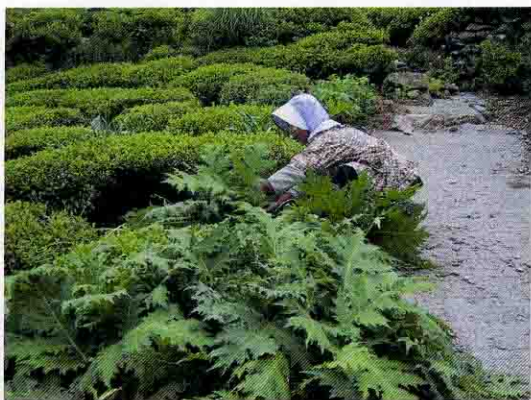
茶畑で栽培される沢あざみ

古くからめでたい日のごちそうとして食べられていました。 春日地区の沢あざみは伊吹山麓の谷筋に自生していたものが少しずつ村内一円に広まりました。昔の人は、炭焼きの為に山々を移り住むたび、苗を持ち歩いたほど大切な食材として古くから親しまれてきました。